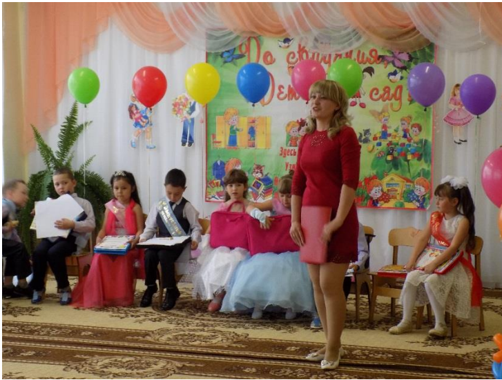
Дети вручают цветы всем сотрудникам и возвращаются на свои места. Заключительный танец «Мы вернёмся»